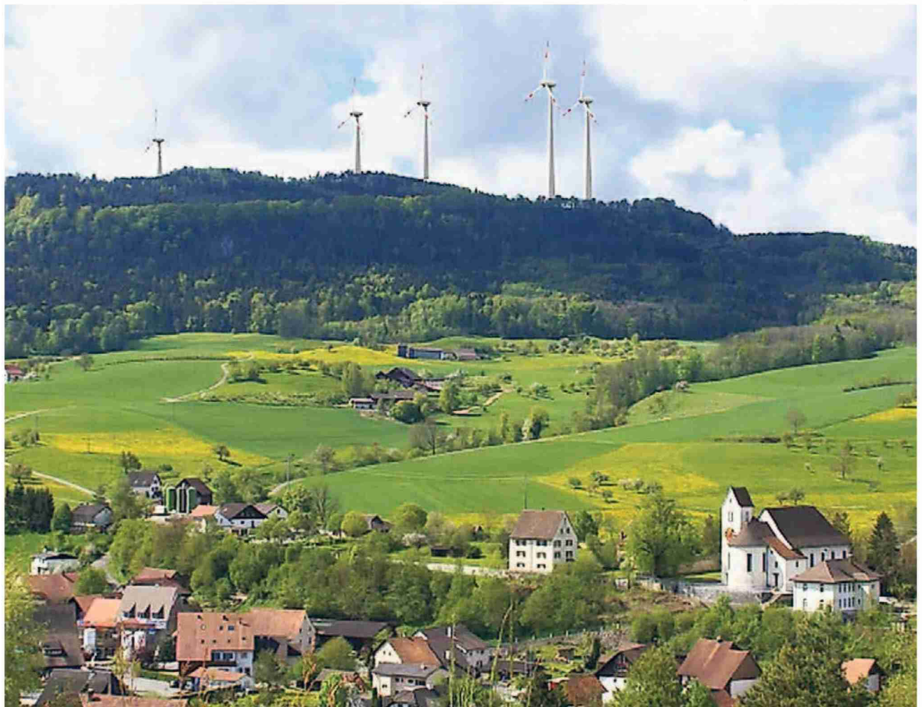
Visualisierung des Windparks Burg bei Oberhof, hier von Wölflinswil aus gesehen.